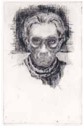
Självporträtt tornålsgravyr ca 1952 ..... × ..... mm