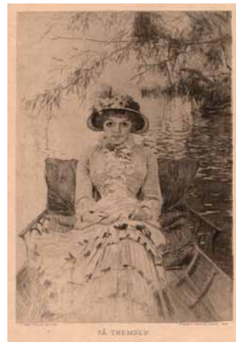
Anders Zorn (1860–1920), På Themsens , etsning (ur FfGK:s första portfölj, 1887)

Två olika sammankomster, två olika sammanslutningar, till synes påtagligt divergenta, men båda med den uttryckliga mål-