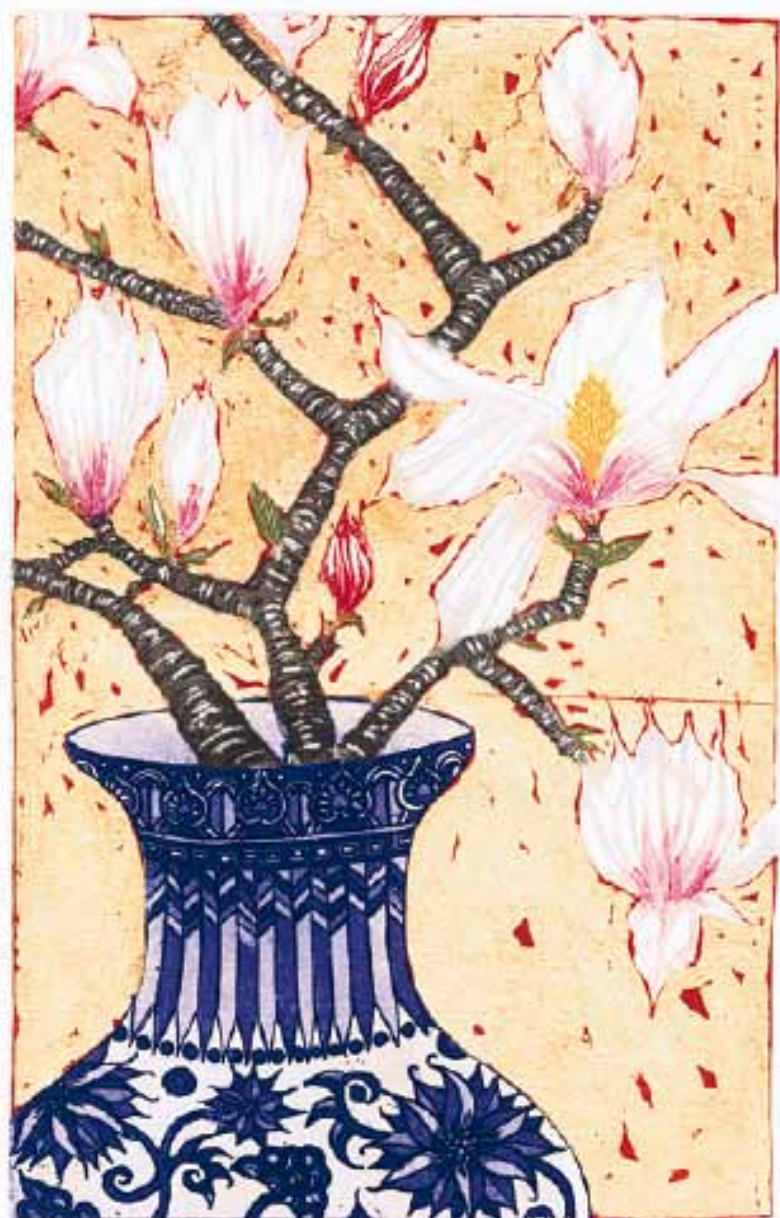
1110 'Magnolia with Golden Leaf' Jean Bardon