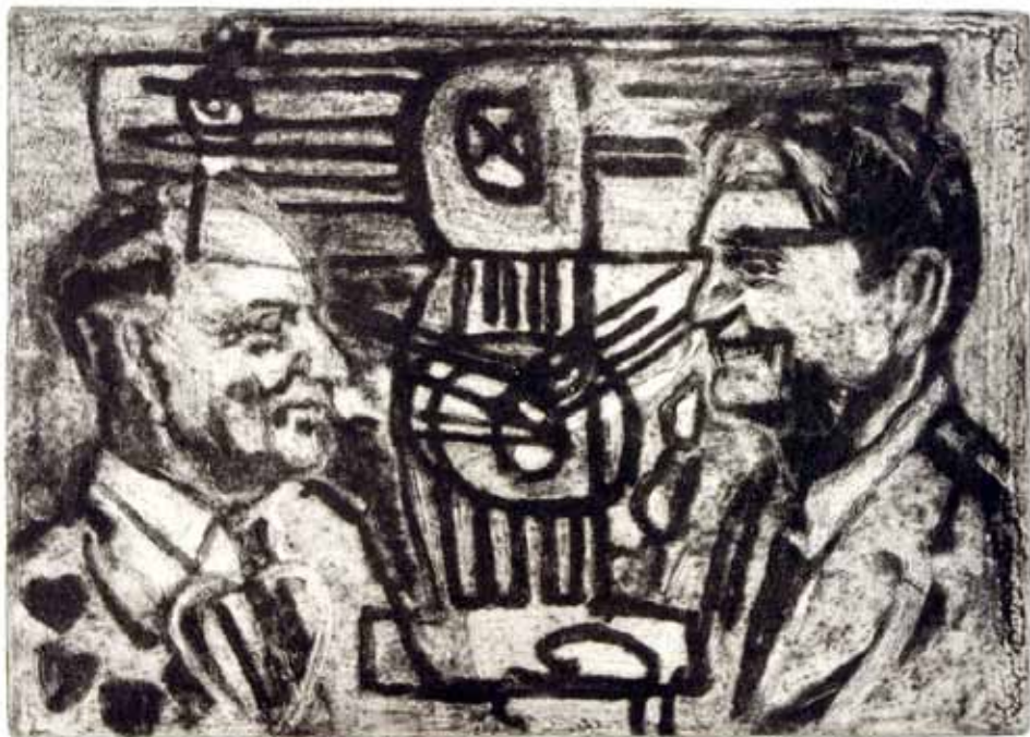
Gunnar Hedlund o statsmin. Olov Palme, spränggravyr 1971