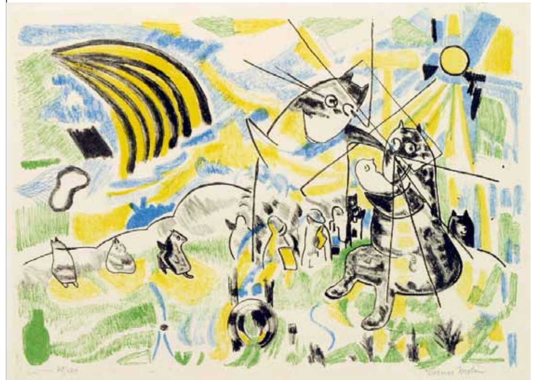
Ovan. I himlen , färglitografi 1950-talet T.v. Piprökande man , torrsmålgravyr 1940

Bilden, som upplevs i kraftigt motljus, kan mycket väl vara ett självporträtt. Här har