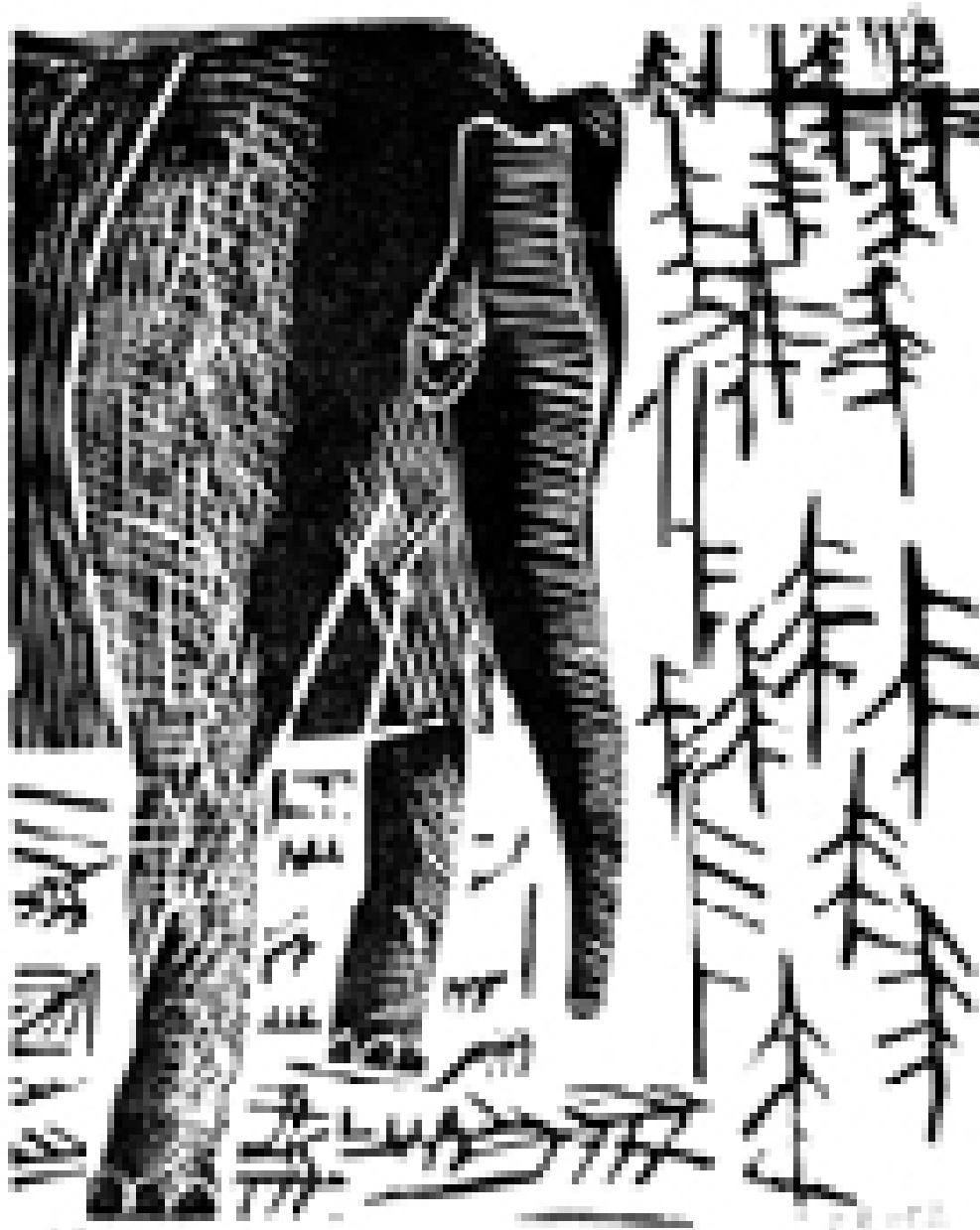
T.v. Elefanten , linosnitt, 235 × 180 mm Nedan. Råttboet , träsnitt, 165 × 200 mm Nedan t.h. Fågel i en skog , träsnitt, 180 × 240 mm

Flera djur tecknades under studietiden vid Slade School of Art i London 1951–1952. Torsten Renqvist ritade till exempel av en elefant i djurparken. Skissblocket var för litet, bara halva djuret rymdes. Ett kvarts sekel senare utför han Lilla elefanten drömmer för Greta Garbos torg i Stockholm. En stor och tre små elefanter, alla rosa och halva, livar upp den platsen på Söder.