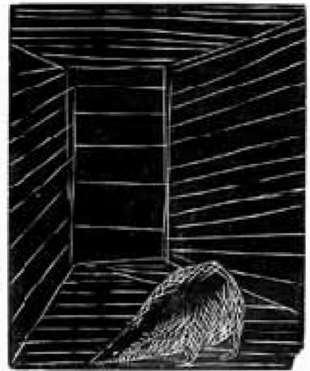
Ovan. Källarråtten , linosnitt, 200 × 160 mm

Källarråtten är instängd i ett randat rum (t.h.). Knaprar den i sig de frihetsberövande kritstrecken för att nå ut i de undre regionerna? Den är ett träsnitt. Apan i rutig kostym har streck till mun, och näsborrar som ett oändlighetstecken. En sols strålar kliar den på ryggen. Den ser både godmodig och bister ut. Den är tryckt som träsnitt och har på trästockens översida en överkryssad igelkott som Torsten Renqvist inte blivit nöjd med. Hjortdjuren , Fiskarna och Rättboet är träsnitt, medan Kråkungen , Räven och Vårtsvinet (t.v.) är linoleumsnitt. Två blad, Fågel i en skog , träsnitt, och Elefanten , linoleumsnitt, ingick ursprungligen inte i portföljen Djur . De har av konstnären generöst erbjudits att få följa med i denna nyutgåva, utförd drygt ett halvt sekel senare.