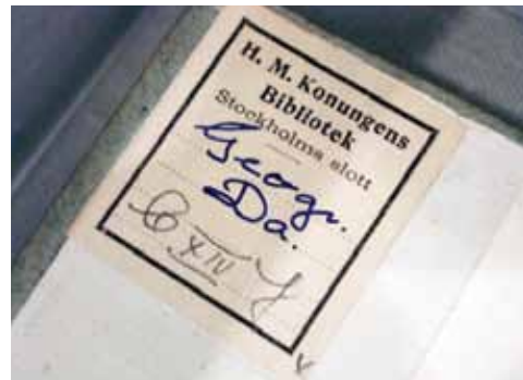
Överst. P. G. Thelanders »Gavnäbb« med uppvaltning. Mellan. Kungens utställningstema är ju »Stora och små djur«. Nederst. Etikett i en av de kungliga grafikportföljerna.

samhetsår, görs snart avdrag från både fotopolymerplåtar och vanliga kopparplåtar.